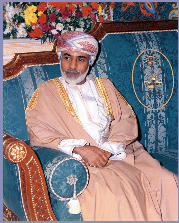
حضرة صاحب الجلالة السلطان قابوس بن سعيد المعظم His Majesty Sultan Qaboos bin Said