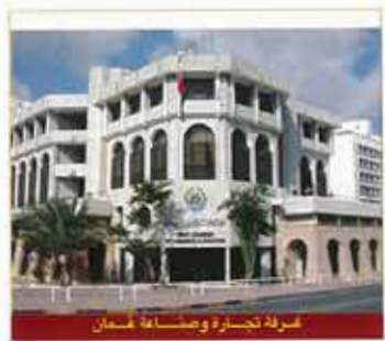
مركز تجارة وصناعة عُمان

«إن التطور والتحديث الواسع الذي يشهده القطاع الخاص والتسهيلات العديدة في جذب الاستثمارات الأجنبية وتفعيل العمل الاقتصادي سيستطلب إحصاءات وأرقام حديثة