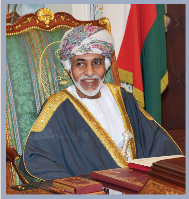
حضرة صاحب الجلالة السلطان قابوس بن سعيد المعظم