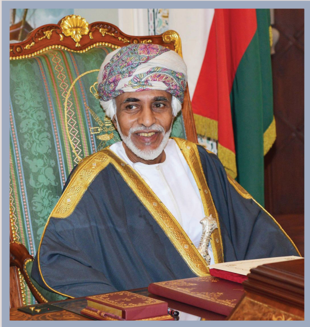
His Majesty Sultan Qaboos Bin Said